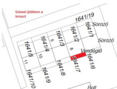
Térkép jelölés.jpg 36K