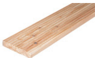
terasz burkolat.jpg 50K