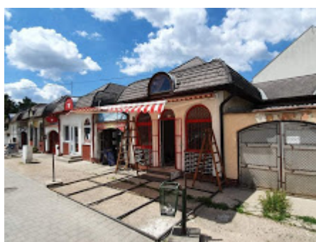
terasz jelenleg.jpg 125K